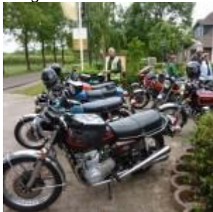
terug na 175km