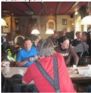
koffie met cake