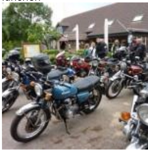
terug na 175km