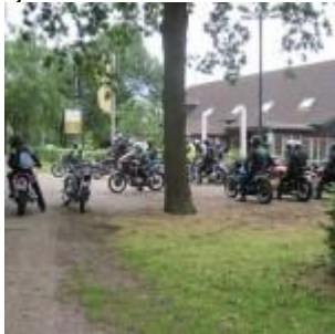
tijd om te vertrekken