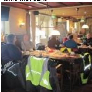
koffie met cake