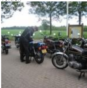
tijd om te vertrekken