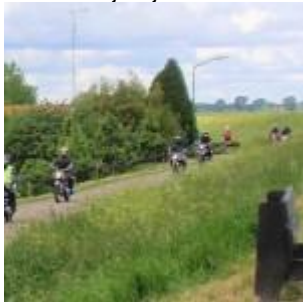
cbs on tour