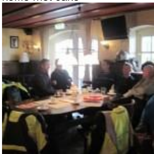
koffie met cake