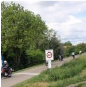
De Maasdijk bij Macharen