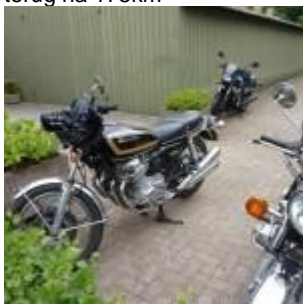
terug na 175km