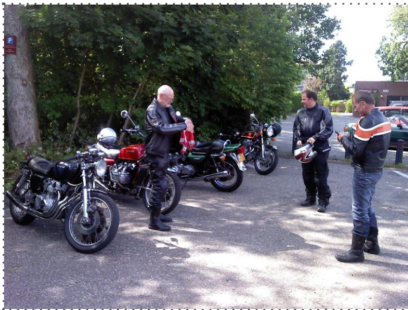
Op de parkeerplaats in Ommen at 2010-06-12