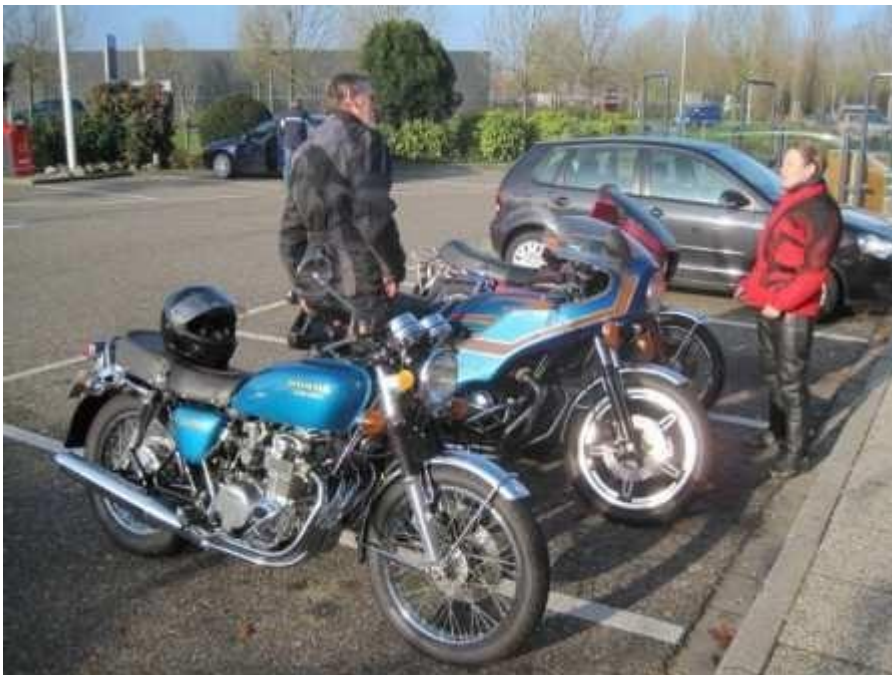
Bij de mac in Beuningen.

Tussentijds was het helemaal opgeklaard en het zonnetje stond aan de hemel dus het kon alleen maar warmer worden.