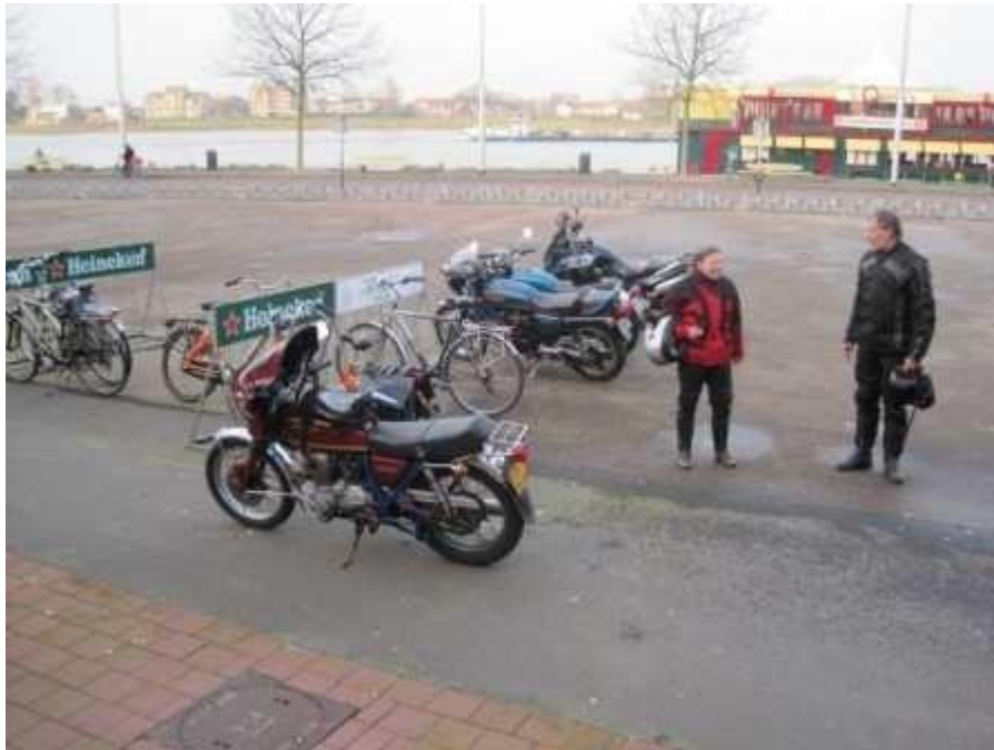
Aankomst Nijmegen Waalkade.

Enige nadeel was dat mijn vingertopjes wel wat koud werden, maar ook dat is weer helemaal goed gekomen