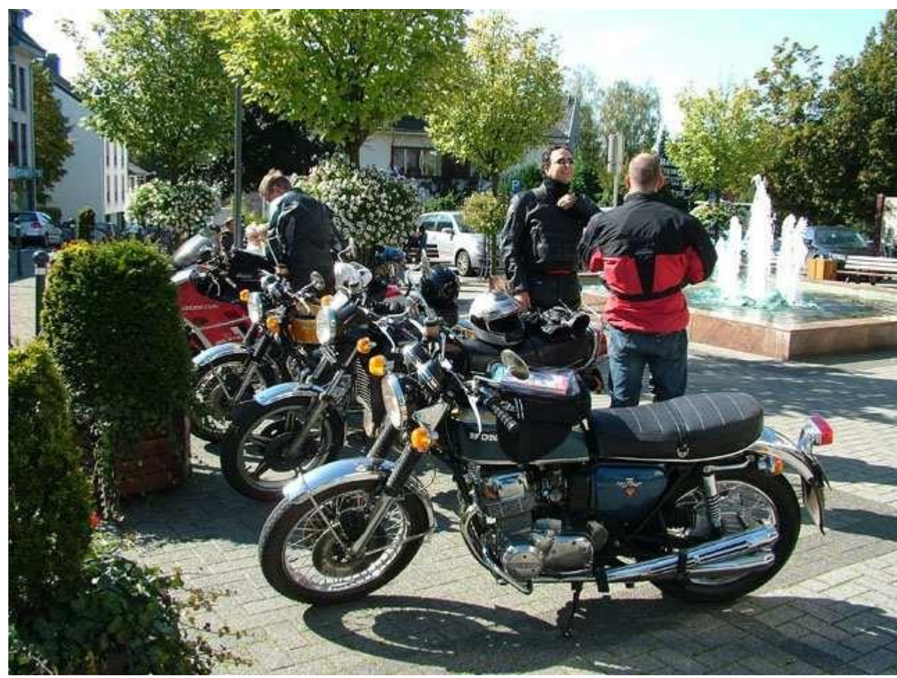
De volgende dag de Tom Tom weer ingesteld. De eerste stop was in Prüm waar we een korte rookpauze hielden.