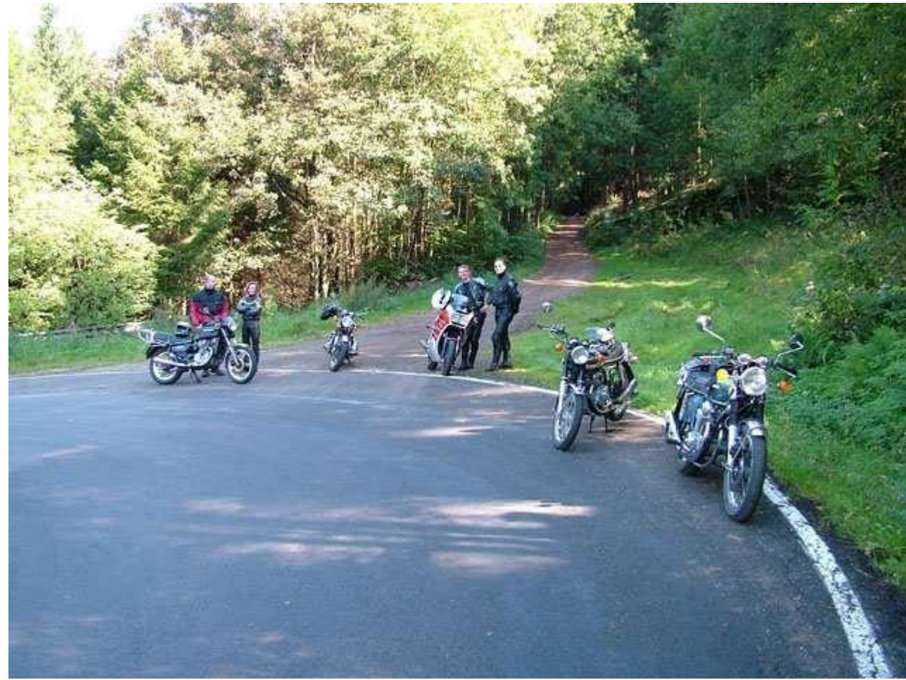
Korte stop zomaar ergens in de Ardennen.