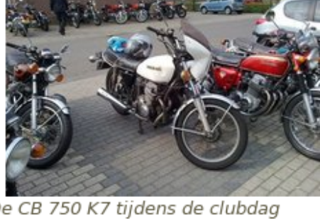
De CB 750 K7 tijdens de clubdag

In de vorige uitgave van InFourmail is melding gemaakt van een CB750 K7 die aan de club is geschonken om aan een lid te geven die er veel plezier van zal hebben. Hoewel de motor er oud uit zag en voorzien was van een dikke laag 'patina' functioneerde vrijwel alles naar behoren. Om de motor aan de leden te showen heb ik er tijdens de clubdag de hele dag op gereden. Het enige wat ik gedaan had was de banden op de juiste spanning gebracht en wat olie bijgevuld. Er was inderdaad achterstallig onderhoud, maar het motorblok draaide als een tierelier. De motor had heel wat bekijks en er kwamen diverse suggesties om leuke dingen met de motor te doen.