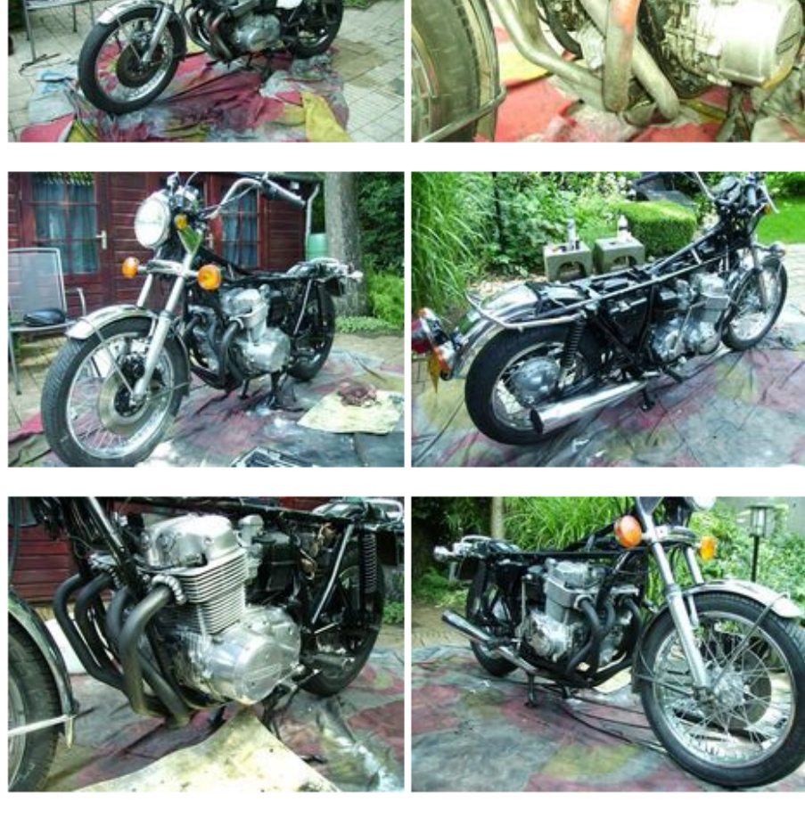
Een deel van de collectie van Edwin: