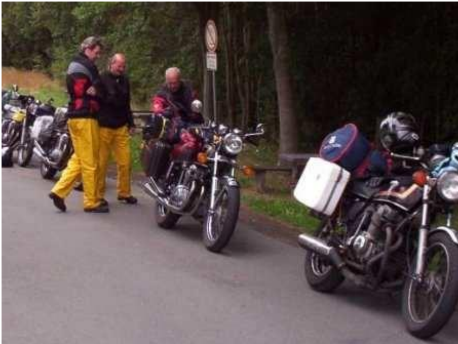
De tenten staan nu eerst een lekker pintje